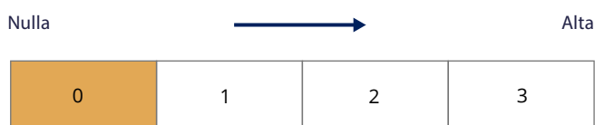
Grafico performance cumulata